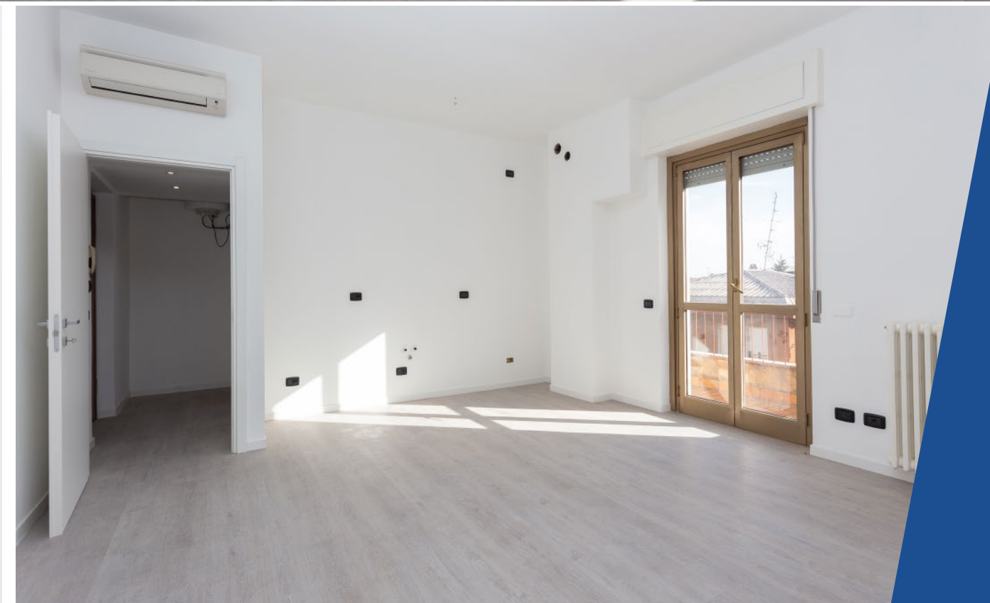
Appartamento open space - BUSTO ARSIZIO