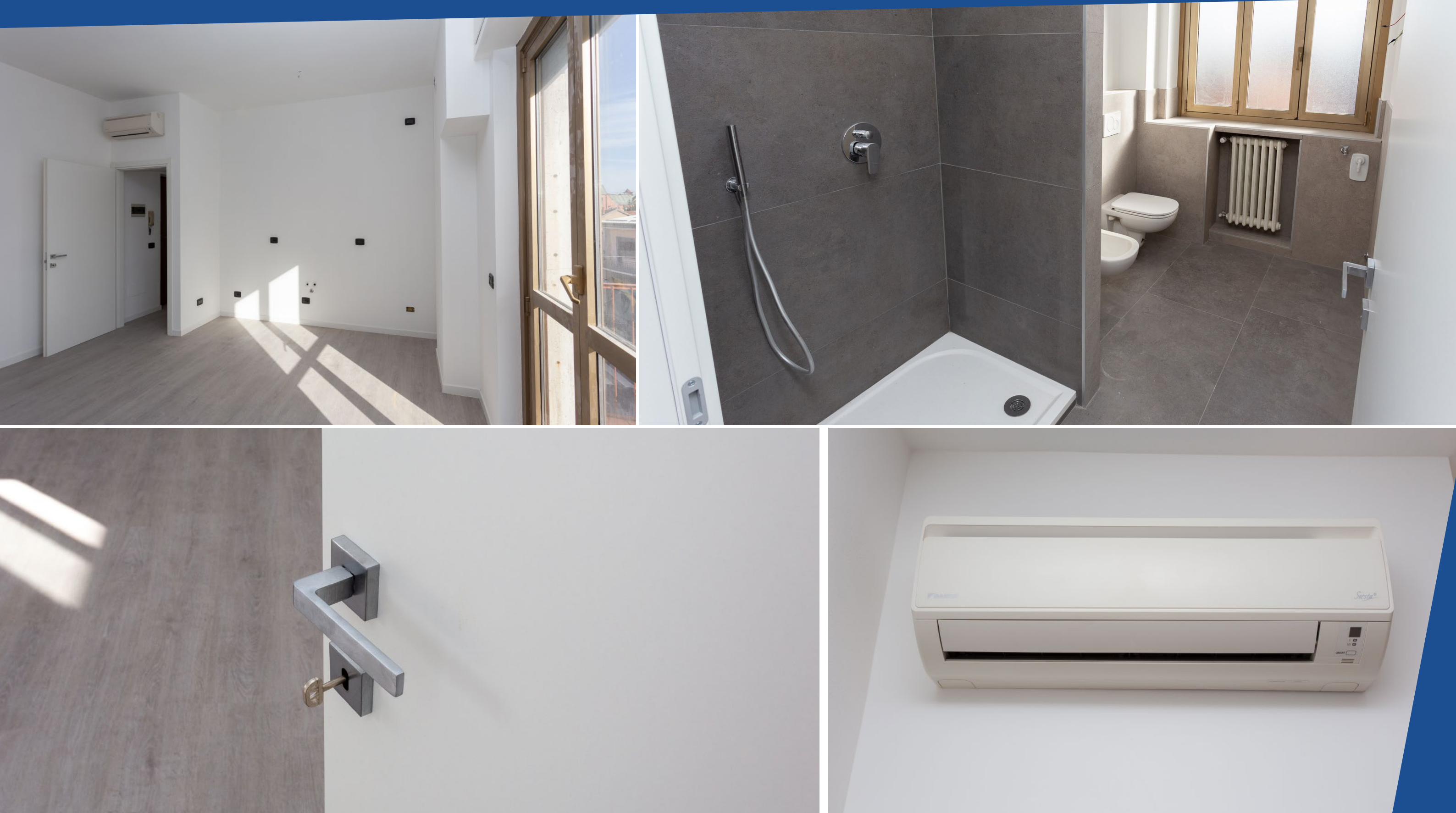
Appartamento open space - BUSTO ARSIZIO