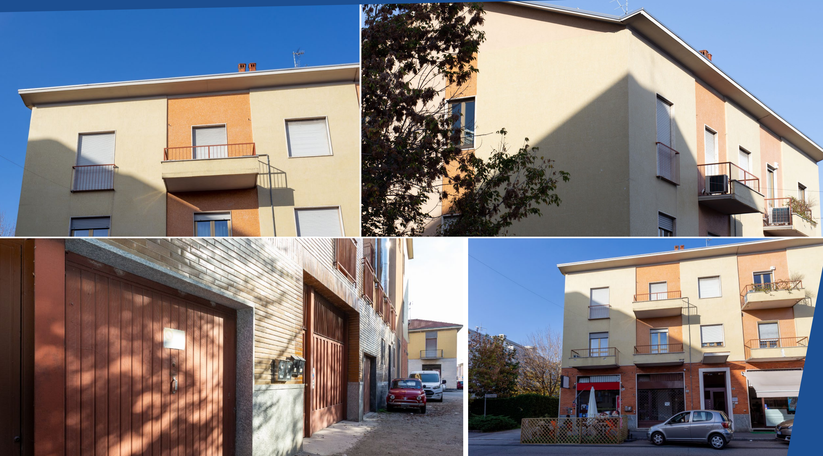
Appartamento open space - BUSTO ARSIZIO